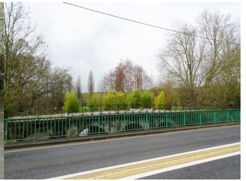
Le pont des Planches vu du pont neuf