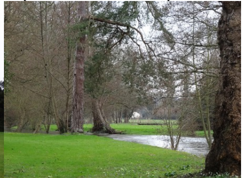
Les berges de l'Iton

Pour la zone en rose foncé dans le périmètre de 500m