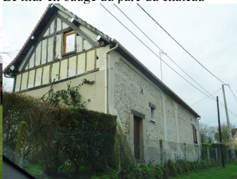
Une maison avec moellons et pans de bois