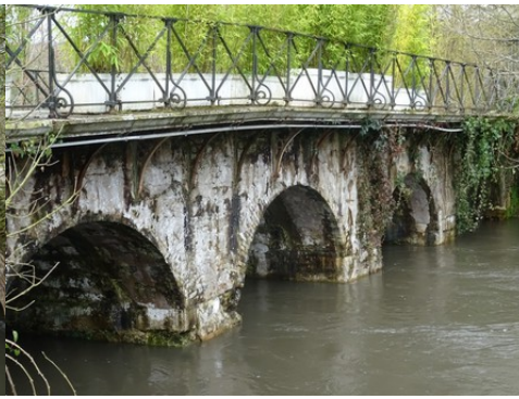
Une vue rapprochée des arches