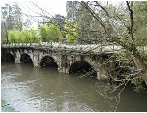
Le pont des Planches vu de la berge