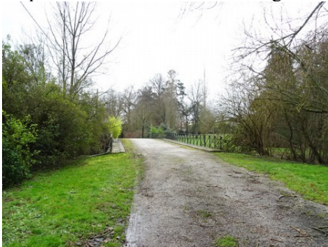
La chaussée du pont