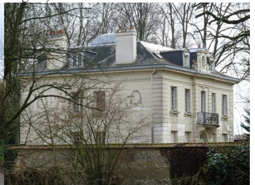
Une demeure bourgeoise