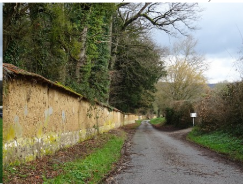
Le mur en bauge du parc du château