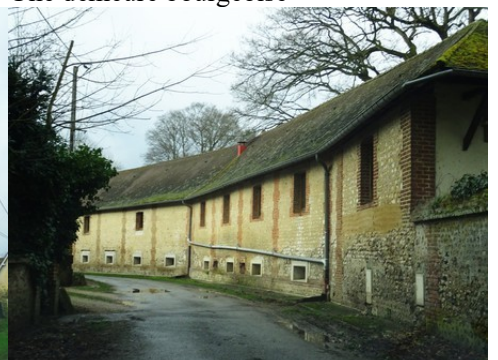
Des édifices associant briques et moellons