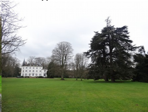
La vue vers le château des Planches