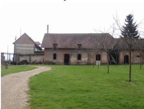
Des exemples d'architecture rurale