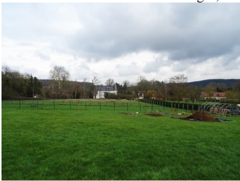
Le château vu des prairies au Sud

Les avis seront cohérents avec ceux émis ces dernières années, à savoir : pas de maisons à volume compliqué (type V, W, Y, ou Z), pentes à 45° pour les volumes principaux, ardoise ou tuile plate de teinte brun vieilli, à 20u/m 2 , avec un débord de toiture de 20cm, enduit de teinte beige clair avec modénatures (au choix : chaînages, encadrement de fenêtres, soubassement, colombage...). *Voir les autres fiches.